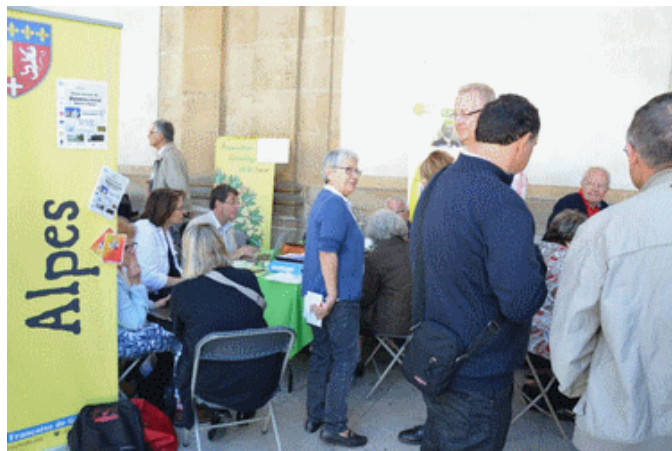
Le coin des associations Rhône-Alpines présentes (ici « Ceux du Roannais », pas de photo disponible du stand CGD)

Pour ceux qui ont la chance de pouvoir s'y rendre, cette manifestation bisannuelle organisée par la FFG est l'occasion de découvrir l'Hôtel de Soubise, siège des Archives nationales, en profitant de rencontres avec nos associations, de conférences et de visites des dépôts du CARAN. Cette année, plus de 8500 visiteurs se sont rendus à ce rendez-vous devenu incontournable.