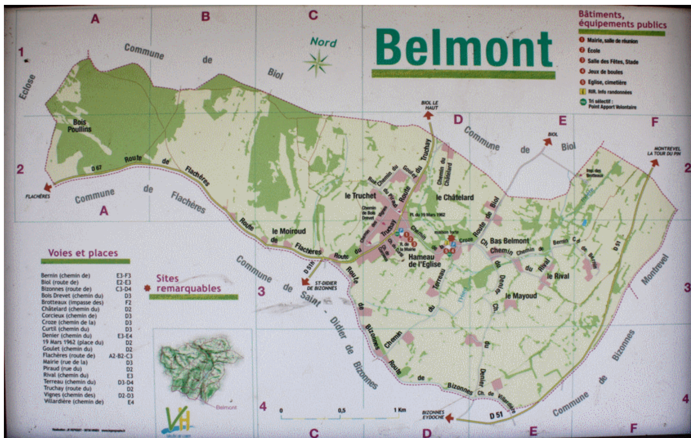
Plan d'accès et vues de Belmont (mairie, salle des fêtes, maison forte)